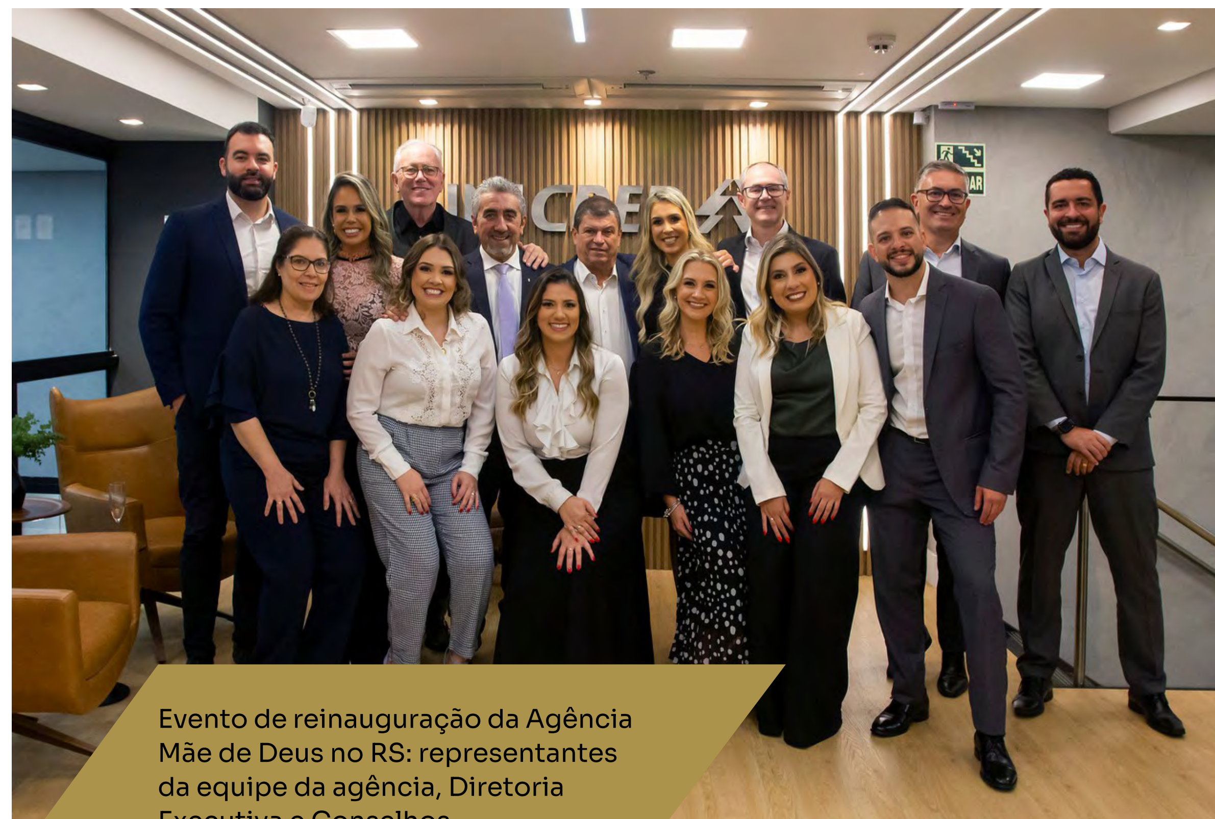
Evento de reinauguração da Agência Mãe de Deus no RS: representantes da equipe da agência, Diretoria Executiva e Conselhos

O projeto da agência é excepcional desde sua concepção, proporcionando maior proximidade com nossos cooperados em um ambiente moderno e aprazível para a realização de consultoria financeira e efetivação de negócios. Há também muita sinergia entre a Unicred Porto Alegre e o Centro Clínico Mãe de Deus. É uma parceria sólida e duradoura, com todos empenhados em oferecer o melhor para os nossos cooperados, razão de ser da Cooperativa.