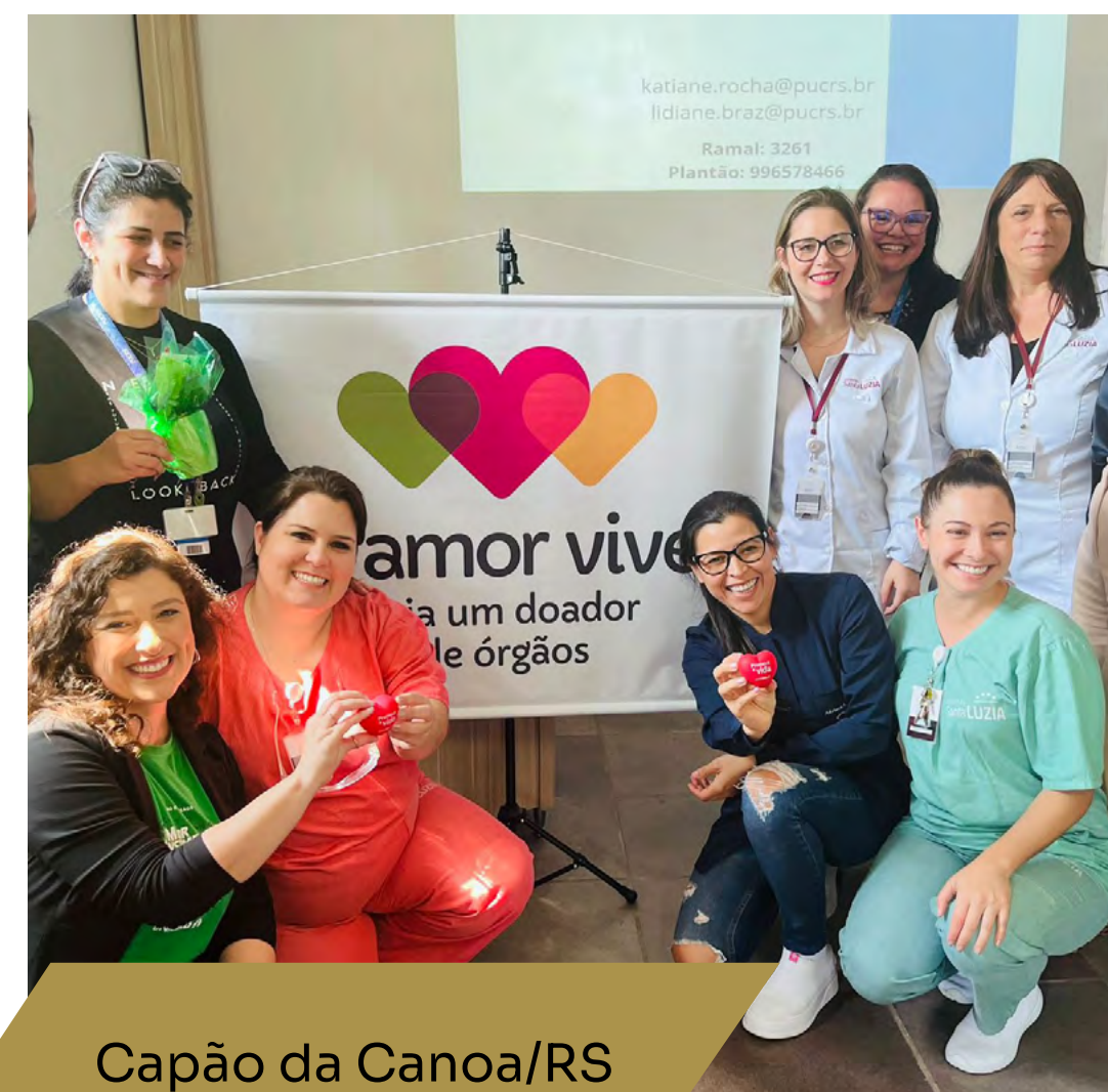
Capão da Canoa/RS