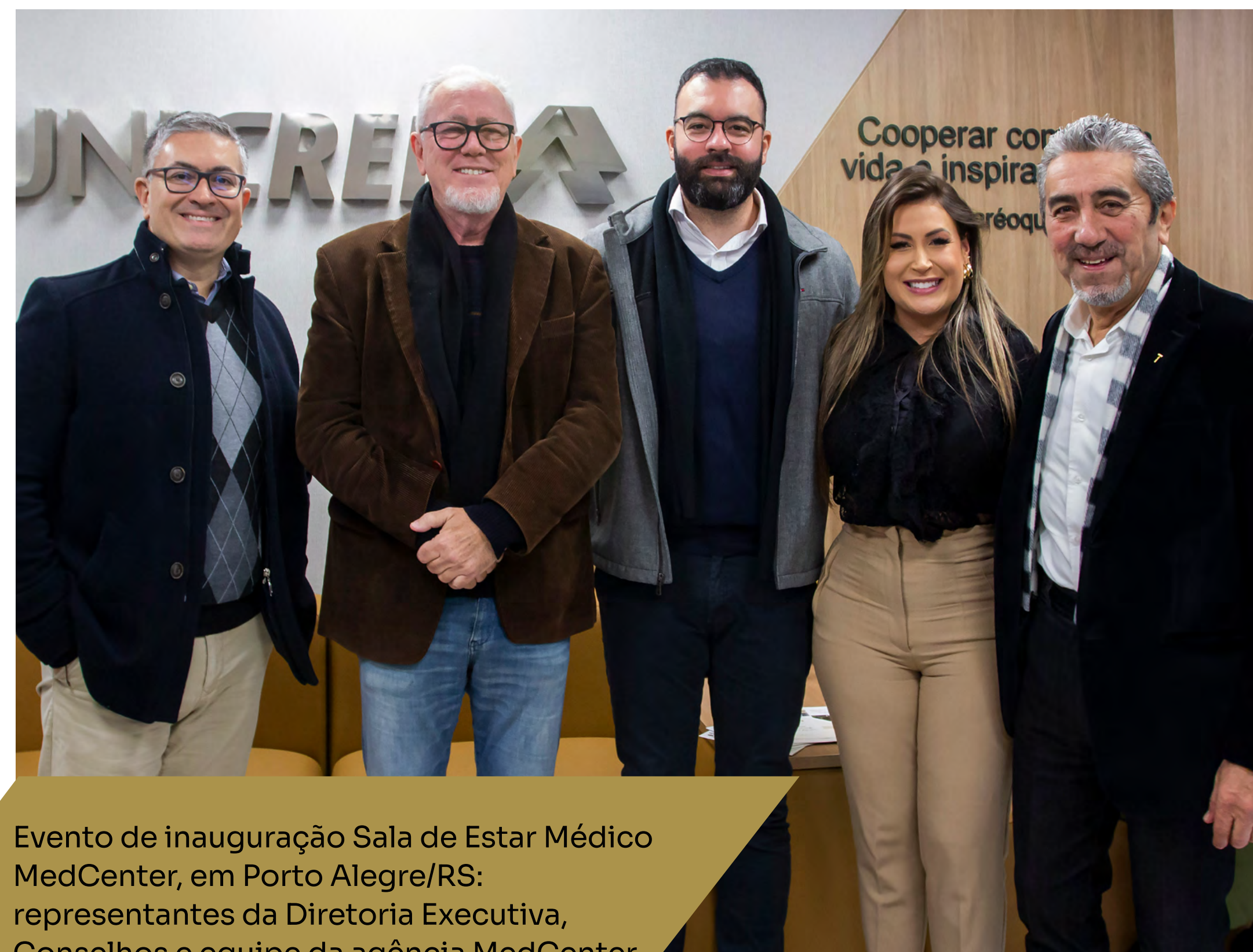
Evento de inauguração Sala de Estar Médico MedCenter, em Porto Alegre/RS: representantes da Diretoria Executiva, Conselhos e equipe da agência MedCenter

natural e mais conforto para os profissionais. Seu mobiliário é moderno e adequado às necessidades pessoais dos médicos, que precisam de pausas compensatórias de forma a se sentirem recuperados, uma vez que lidam com a vida dos pacientes. É imprescindível um ambiente adequado para o descanso desses profissionais. A humanização do ambiente nos momentos de relaxamento mantém o equilíbrio da mente e do corpo.