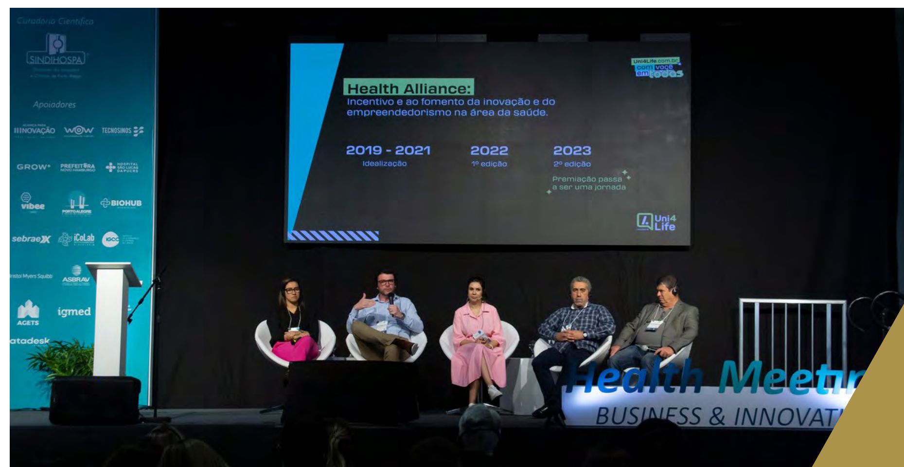
Health Alliance, no Health Meeting