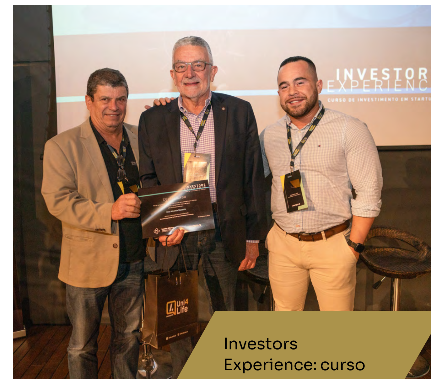
Investors Experience: curso de investimentos em startups