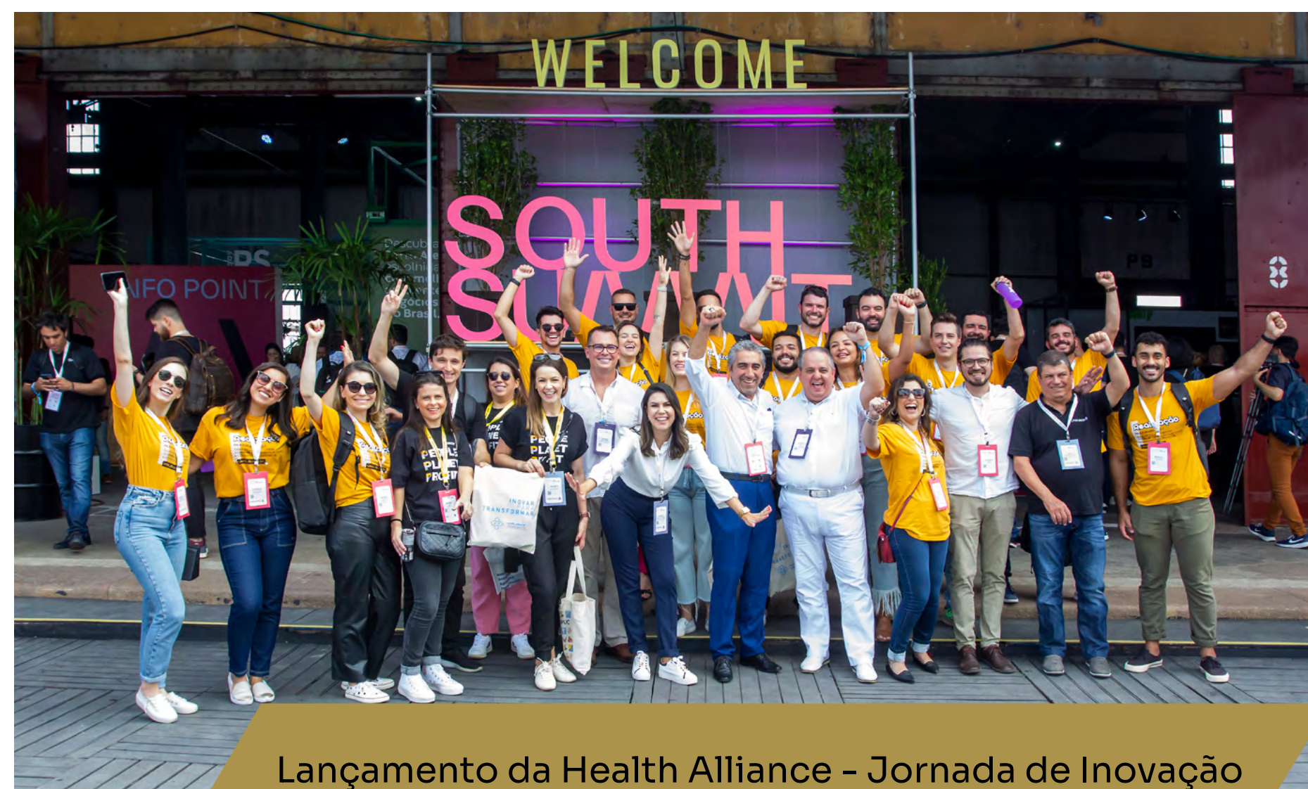
Lançamento da Health Alliance - Jornada de Inovação e Empreendedorismo no South Summit Brazil