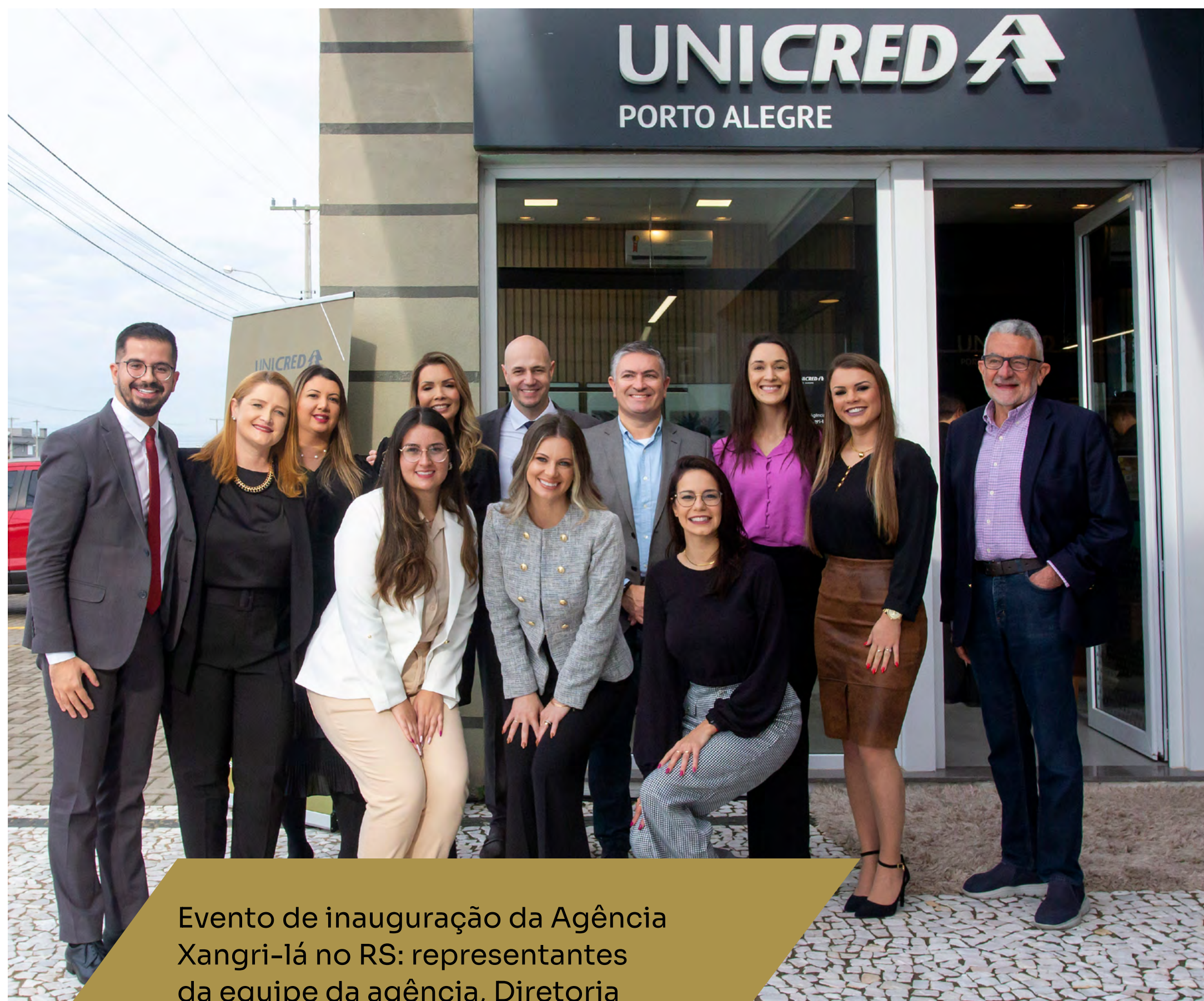
Evento de inauguração da Agência Xangri-Lá no RS: representantes da equipe da agência, Diretoria Executiva e Conselhos